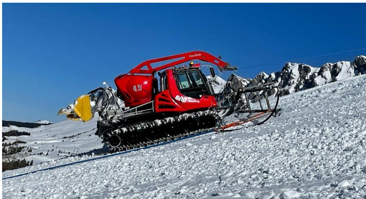
Pistenbully der LBB bei der Präparation der Weltcupstrecke

Allen freiwilligen Helfenden der FIS Slalom Rennen und des AUDI FIS SKI WORLD CUP 2022, die stets mit Herz und Seele dabei sind, den Sponsoren und treuen Donatoren, sowie unseren Vereinsmitgliedern von jung bis alt!